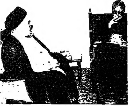
يتحدث الى العمارة فضل الله